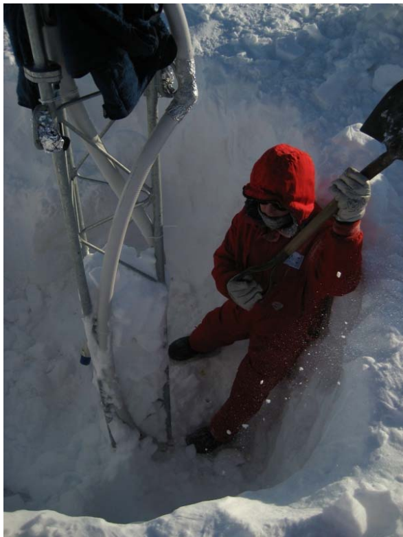
Graben, graben, graben...

Seismometers nach Neumayer, wo wir die Daten auswerten. Am Olymp müssen wir die jährlichen Wartungsarbeiten durchführen. Der Hauptteil dieser Arbeit besteht aus Buddeln. Hier in den höheren Lagen gibt es einen beträchtlichen Schneezutrag von zwei bis drei Metern pro Jahr. Also müssen wir sämtliche Anlagen, die zum grössten Teil in Holzkisten verstaubt sind, erstmal orten und dann ausgraben. Wir überprüfen die Geräte und die Akkus, die vom Solarstrom gespeist werden und verschliessen dann die Kisten wieder schneedicht. So bleiben sie stehen und werden in den nächsten Monaten vom Schnee bedeckt, bis sie nächstes Jahr wieder ausgebuddelt werden.