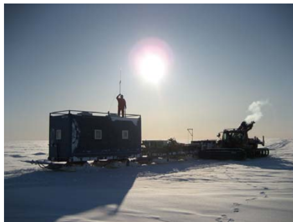
Der Pistenbully mit angehängtem Wohncontainer

Vergessenes nicht einfach schnell im Supermarkt einkaufen gehen, und Passanten, die einem Pannenhilfe geben könnten, sind auch selten. Nora und ich packen also sorgfältig das Material für unsere Arbeiten. René und Michael rüsten den Bully und den Anhängerzug, der einen Wohncontainer mit fünf Betten und eine kleinen Küche miteinschliesst sowie zwei grosse Schlitten mit den ganzen Gerätschaften: beispielsweise einen Skidoo, mehrere Fässer Treibstoff, einen Dieselgenerator, der für Strom sorgt, und alle möglichen Werkzeuge und Ersatzteile, um den Bully und den Generator im Fall der Fälle reparieren zu können. Mike schliesslich ist fürs leibliche Wohl zuständig. Ich gehe ihm zur Hand und nehme staunend Salami, Nudelpackungen, Konserven und Vieles mehr entgegen. Ein schöner Haufen Proviant kommt so zusammen, der für uns reichen sollte, selbst wenn wir durch schlechtes Wetter aufgehalten werden sollten.